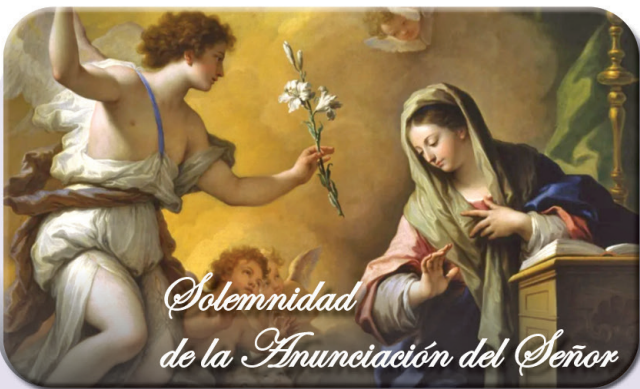
Solemnidad de la Anunciación del Señor

“Vas a concebir en el seno y vas a dar a luz un hijo, a quien pondrás por nombre Jesús”. Lc 1,31